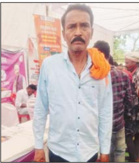
इंभारत लिख दी है।